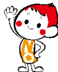
禁煙推進キャラクター まもるくん

※三次喫煙は、タバコを消した後の残留物から有害物質を吸入することです。残留物は洋服や髪の毛、カーペットや壁、床などにあります。